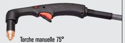
Torche manuelle 75°

(pour plus d'options de torche, consulter www.hypertherm.com )