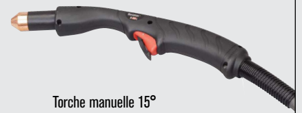
Torche manuelle 15°